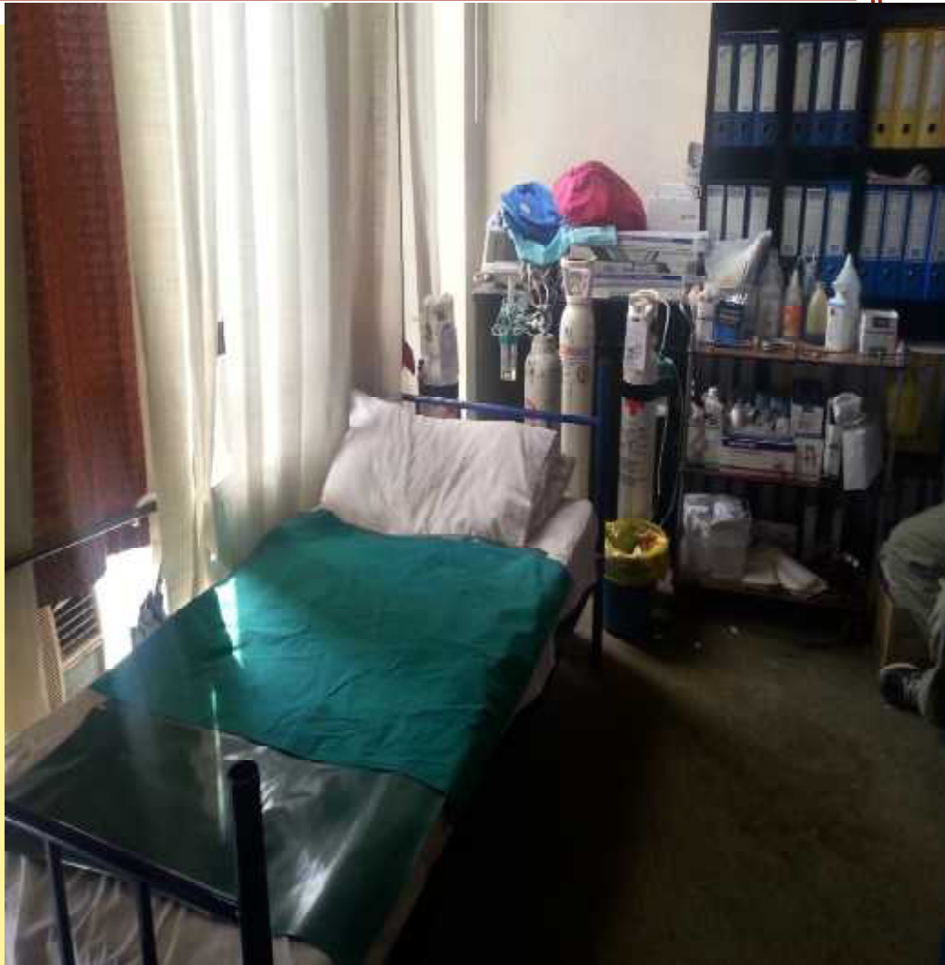
Rad u hotelu