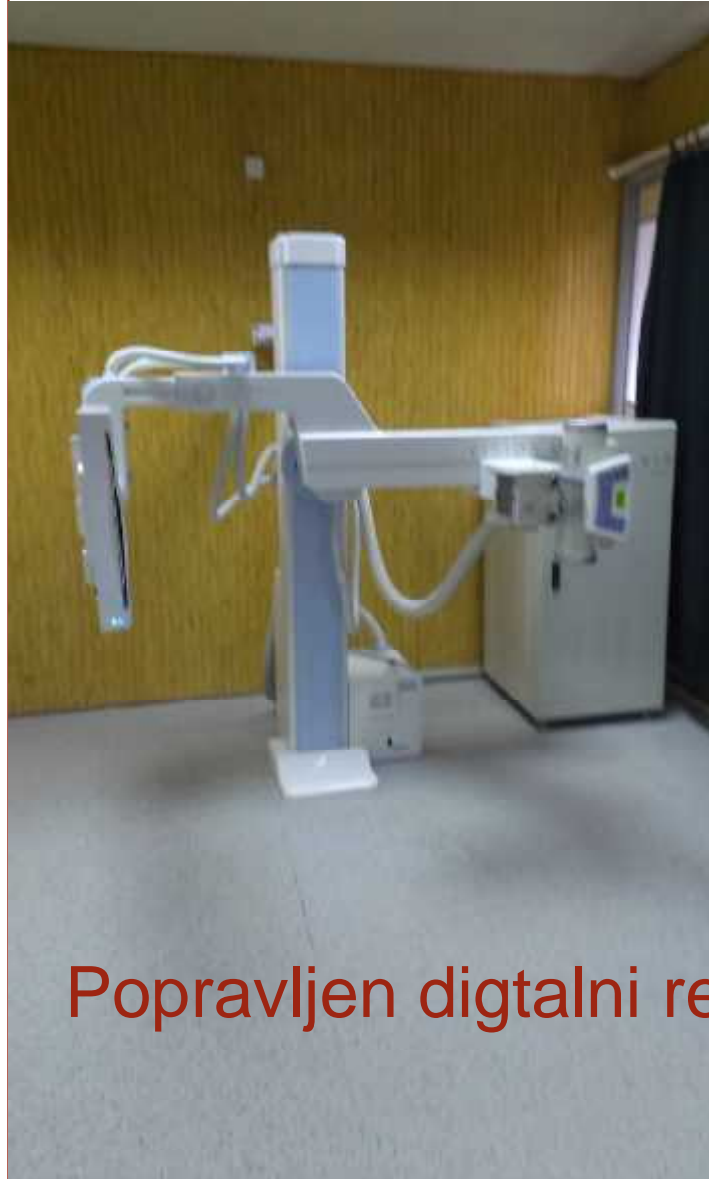
Popravljen digitalni rendgen