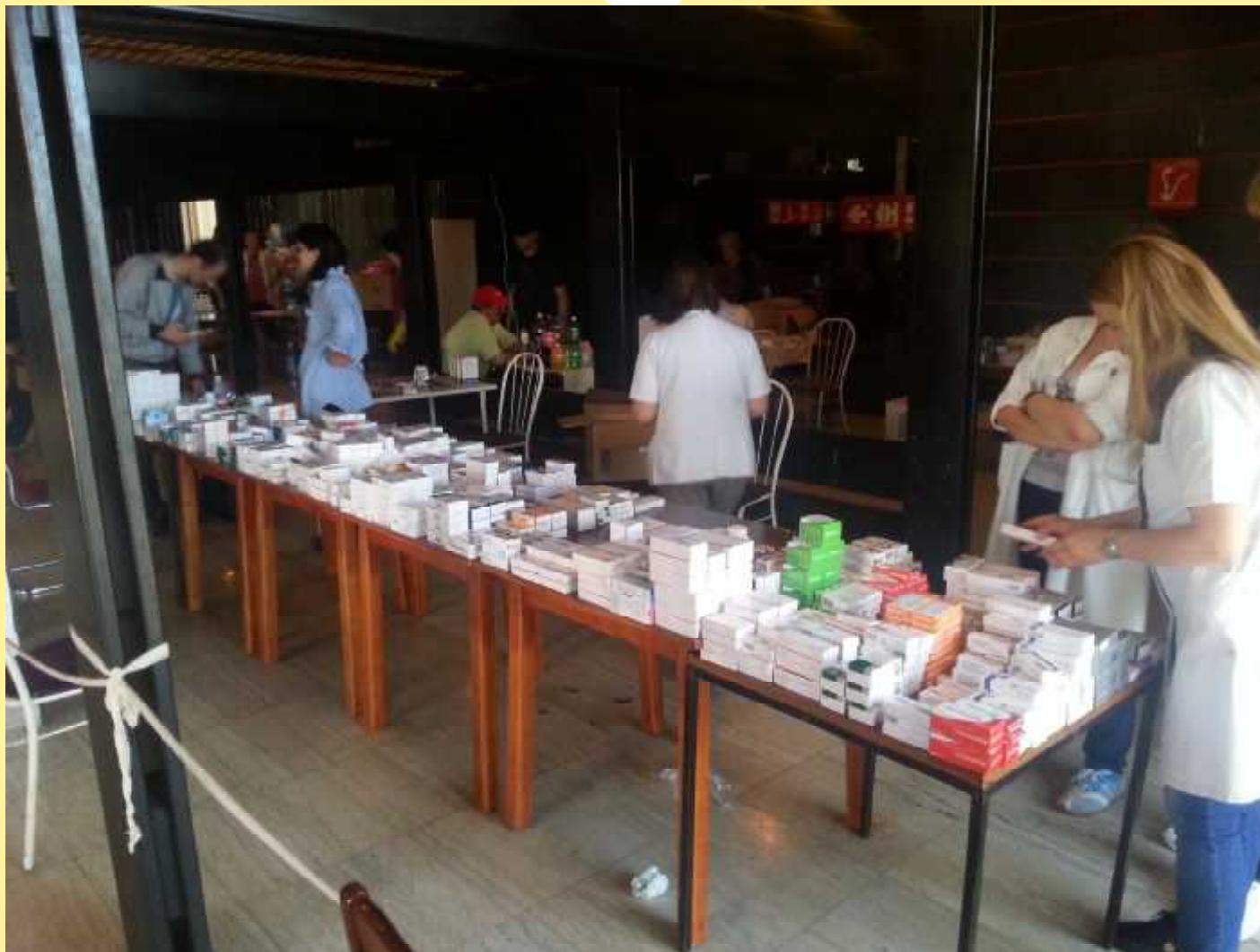
Rad u hotelu